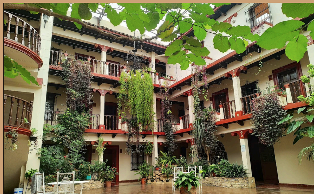
HOTEL D' MÓNICA

**MISMA TARIFA EN TEMPORADA BAJA Y ALTA.